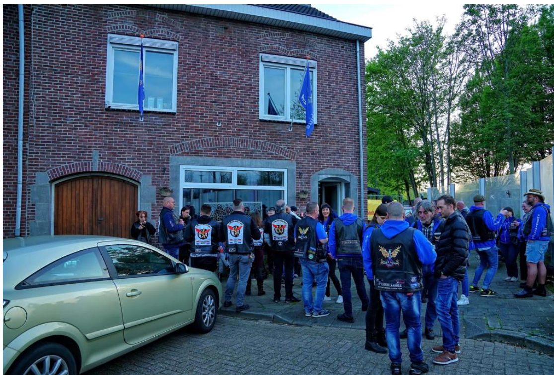
Een druk bezocht Open Honk. Foto met dank aan Olaf Bok die ook gezellig even op visite kwam.