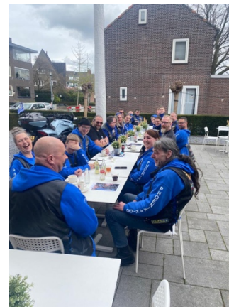
En natuurlijk moesten we ook even zorgen voor de inwendige mens. Wel zo belangrijk!

We hebben uiteindelijk tot vier uur het 's middags gereden. Want ieder kind heeft ook even aandacht nodig en wil zijn verhaal kwijt aan zijn/haar beste vrienden. Sommigen wilden zelfs nog een stukje rijden en daar nemen we altijd de tijd voor. We hebben genoten en de kinderen waren weer blij met deze speciale aandacht voor hun.