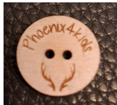
Pssst, maar meer zullen we nog niet verklappen!

Ze zijn serieus ermee bezig en op onderstaande foto zien jullie al een kleine sneak peak van een idee van de ouders. Hebben jullie nu ook een idee en wil je een sponsoractie opzetten? Neem dan vooral contact op met het Bestuur via Info@phoenix4kids.nl