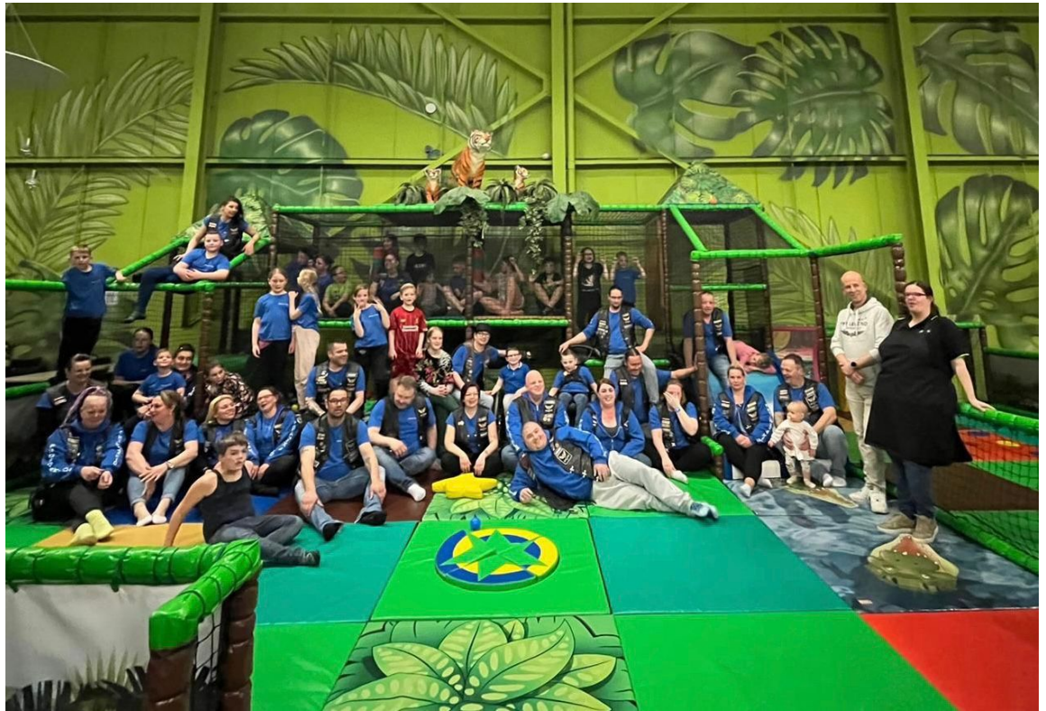
Groepsfoto van iedereen die vandaag samen gespeeld heeft in Monkeytown te Heerlen.

Al met al was het een zeer geslaagde dag en waren alle kinderen (en wij ook) erg tevreden.