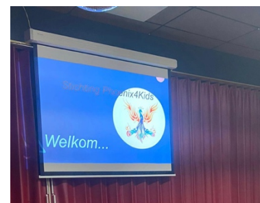
Presentatie van de Childtrust.

Hier worden de noodzakelijke dingen besproken die van belang zijn in de omgang met het kind. Bv. Het kind houdt niet van knuffelen, of het kind vind harde geluiden niet fijn. Maar ook bijv. de manier van tillen door een lichamelijke beperking, of wat moet je doen bij nood en wat kan er gebeuren met een kind. Hoe dien je dan te handelen? Het was een hele informatieve avond waardoor we nog beter bij de kinderen aansluiten. Een grote dank naar de Childtrust, dat zij dit zo goed verzorgd hebben met een hele duidelijke uitleg!